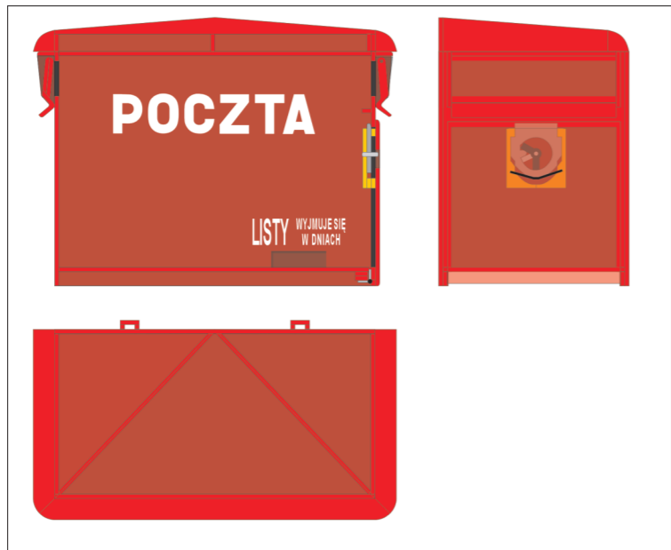
Rysunek główny modelu skrzynki pocztowej z lokalizacją wzmocnień