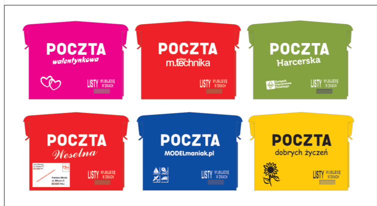
Przykładowe malowania różnych młodotechnikowych skrzynek wrzutowych