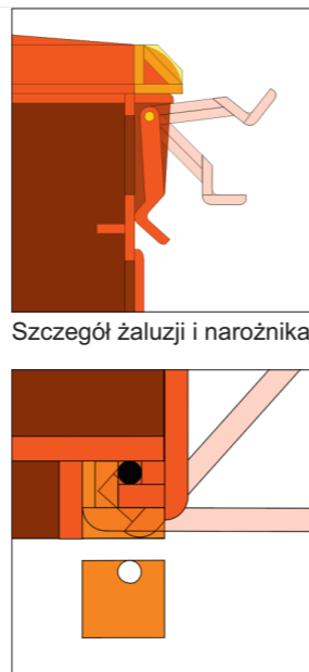
Szczegół żaluzji i narożnika