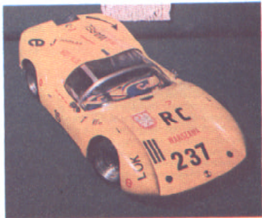
Model redukcyjny samochodu „Lamborghini”. Jest on zdalnie sterowany, ma 3 prędkości do przodu oraz bieg wsteczny. W czasie jazdy może zapalać reflektory oraz włączać kierunkowskazy. Model wykonał Marek Wójcik